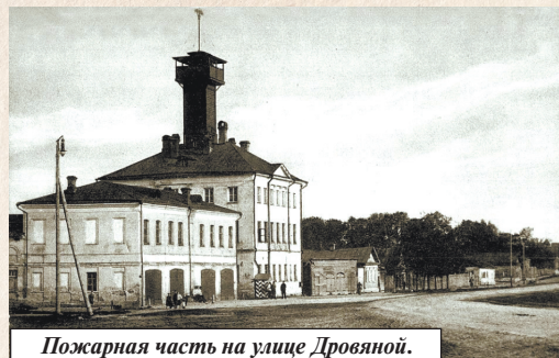
Пожарная часть на улице Дровяной.

В 1802 г. создается Министерство внутренних дел – самый крупный полицейско-финансовый орган. В его подчинении находились высшая губернская администрация, полиция с по-