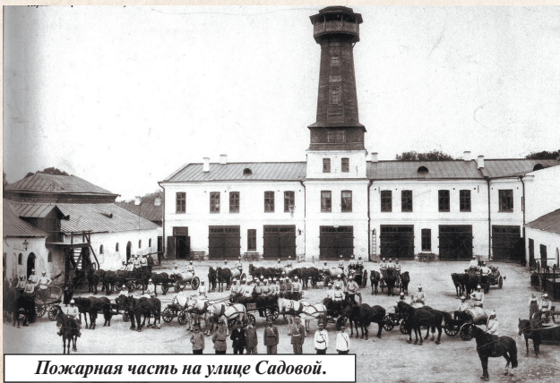
Пожарная часть на улице Садовой.

Двадцать третьего апреля 1733 года в соответствии с Высочайшей резолюцией на доклад Главной полицеймейстерской канцелярии в Калуге создана полицеймейстерская контора, в штат которой были включены должности брендмейстера и фурманщика для заведывания фурманским двором, в котором содержались лошади, пожарные экипажи и инструменты. Позднее в штат конторы была