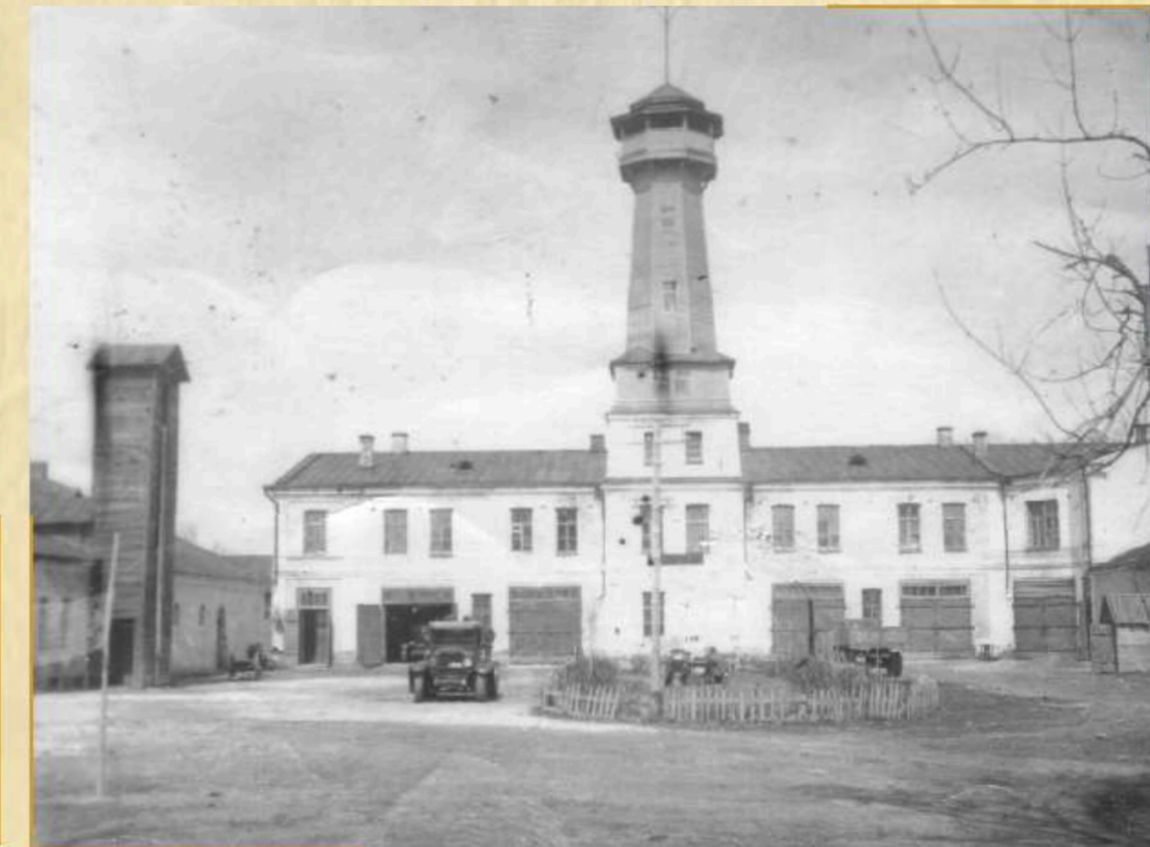
Здание 1-й пожарной части г. Калуги (начало XX века)