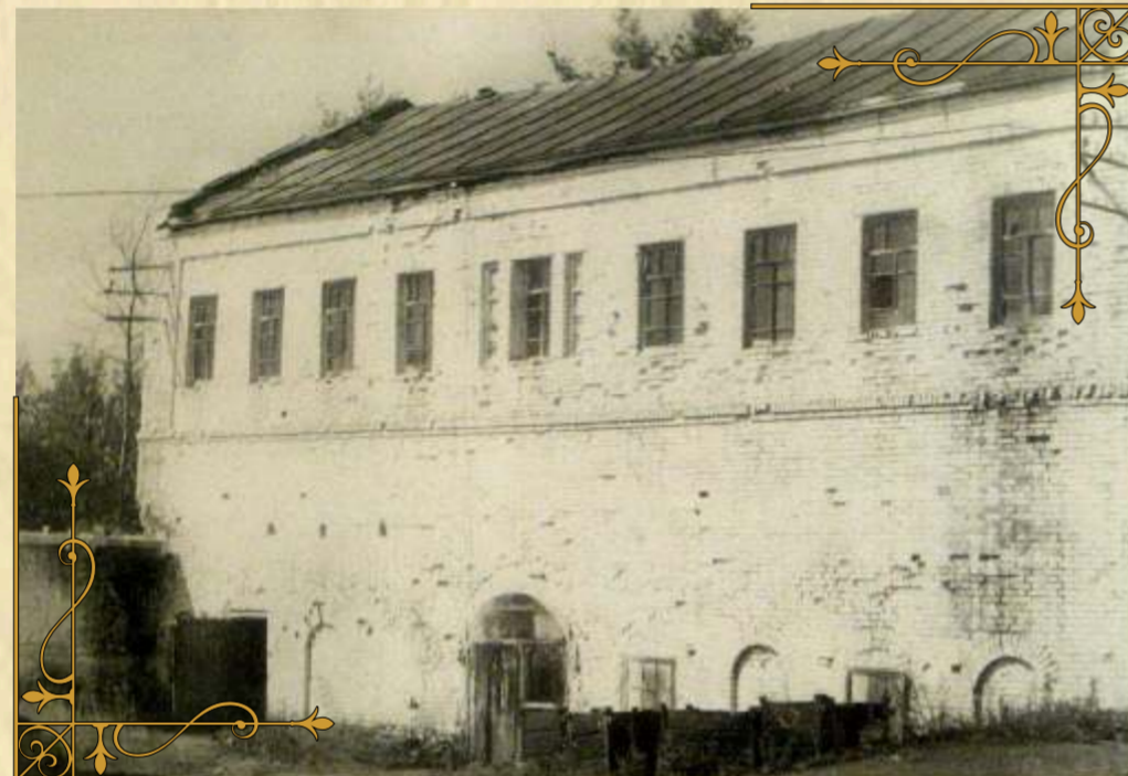
Песоченский ЧЛЗ (начало XX века)