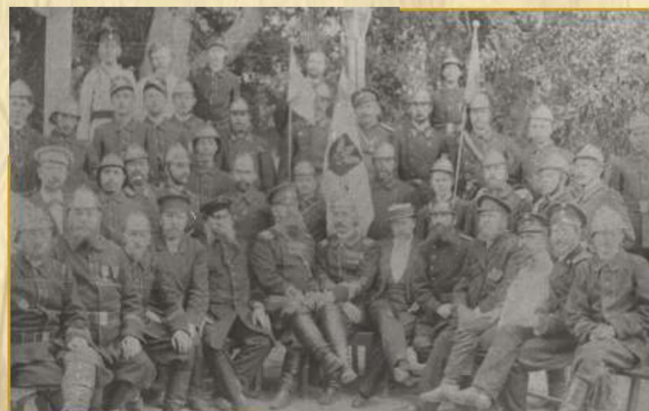
Мещовская вольная пожарная дружина (начало XIX века)

В Отчете Губисполкома и Губернского экономического совещания с 1 окт. 1922 г. по 1 окт. 1923 года поднимается вопрос о наличии в городах системы водопроводов. Как выяснилось, они имелись в Калуге и Козельске. В последнем водопровод находится в зачаточном состоянии. Система канализации существовала только в Калуге, и то очень ветхая.