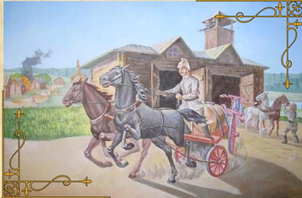
Пожарная команда спешит на помощь

В 1927 году планируется на пожарную охрану городов 35000 руб., села – 50000 руб.