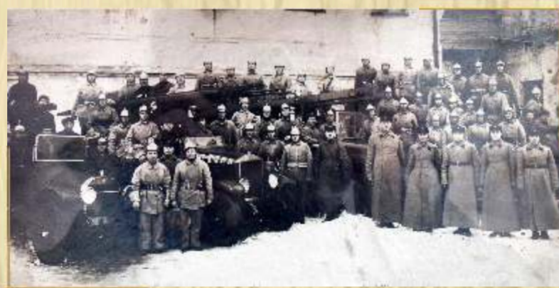
Калужская первая пожарная часть (1923г.)

Интересны с точки зрения пожарной безопасности требования Обязательного постановления №42 «О порядке распланирования и застройки селений в Калужской губернии». За их неисполнение, повлекшее тяжелые последствия, устанавливалась Уголовная ответственность. Были разработаны правила застройки селений, где предусматривалось обязательное деление на кварталы длиной не более 240 метров. Переулки между кварталами застраивать запрещалось, ширина их должна была быть не менее 12м80см. Ширина улиц «между лицевыми границами усадебных участков» должна была составлять не менее 25 метров и состоять из дороги (15м) и зеленых насаждений по обе стороны (5м30см) Если условия не позволяли уложиться в данные размеры, то строительство осуществлялось с одной стороны. Здания общественного назначения строились на более свободных площадях. Так школьная усадьба составляла 1га, больнице предоставлялось 3га. В селениях, где было не менее 100 усадеб обязательно должно было предусматриваться место для базаров, площадей, которые бы имели два противоположные выезда. Улицы, переулки, площади в селениях планировались с продольными и поперечными уклонами, окапывались канавами, обсаживались деревьями лиственных пород. Сами же улицы требовалось замостить, шоссировать, засыпать гравием или хрящом.