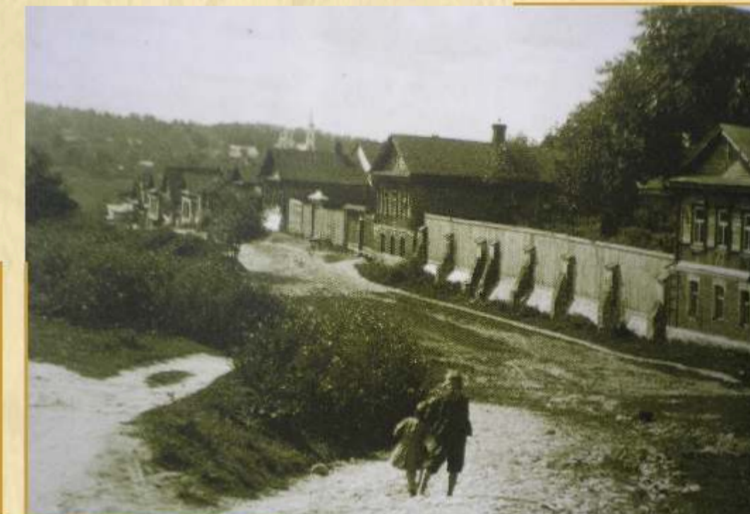
г. Калуга ул. Берендяковская

К началу 1917 года в Калужской губернии, занимавшей территорию в 30982 кв. км, имелось 11 уездов с 198 волостями, 14 городов, из которых 11 были уездными центрами и 3 заштатными, 23 пригородных и 11658 других поселений, пожары достигали значительных размеров. Особенно это относилось к сельской местности.