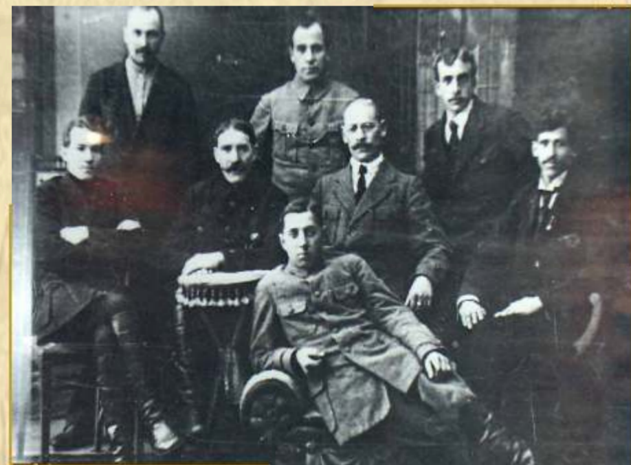
Члены коллегии пожарно-страхового отдела Калужского Губернского совета Народного хозяйства 1919 г. Калуга

В том же году Пожарно-страховой отдел Калужского Губернского Совета народного хозяйства выпустил первый Пожарно-страховой бюллетень, где обобщалась вся информация о состоянии пожарного дела в губернии за период с 1 января по 1 октября 1919 года. Городских пожарных команд в этом году насчитывалось 12 с количеством служащих 198 человек. В своем распоряжении команды имели 84 лошади, 22 ручные машины и 1 механическую. Добровольных пожарных дружин насчитывалось в городах – 9, фабричных – 7, сельских – 107. Для обследования водоснабжения губернии в противопожарном отношении и осведомительной деятельности при Пожарно-страховом отделе было создано Гидротехническое бюро. В качестве мер по предупреждению пожаров предлагались новые постановления о мерах предосторожности, «восстановление кустарных мастерских по изготовлению гончарной черепицы кирпича и открытию новых, снабжение населения огнестойкими материалами – кровельным железом, искусственным шифером, черепицами и др