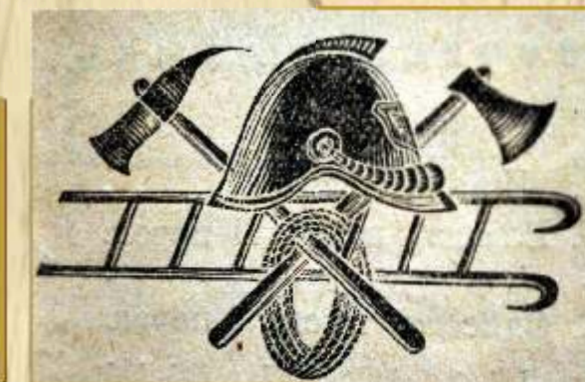
Эмблема Калужских пожарных (начало XX века)

В 1917 году в губернии существовало 16 ВПО: в каждом уездном городе (кроме Жиздры, где действовала Вольная Пожарная Дружина - ВПД), заштатных городах (кроме Воротынского, в котором не указаны ни ВПО, ни ВПД) и в трех крупных сельских пунктах Мещовского уезда - в селах Утешево, Щелканово, Хламово. В губернском городе Калуге одновременно действовали Калужская городская пожарная команда, Добровольное пожарное общество г.Калуги и Калужское пригородное (в слободе Подзавалье) пожарное общество со своими командами.