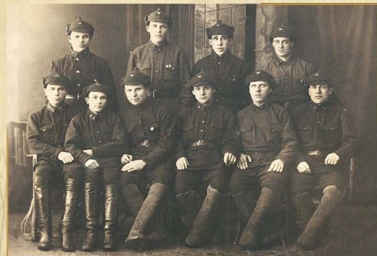
Пожарные с площади Социализма (пл. Победы) 1940 г.

В предвоенные годы пожарная охрана страны представляла сильную организацию, целенаправленно обеспечиваемую кадрами и необходимой техникой. Был введен в действие «Боевой устав пожарной охраны», «Устав внутренней службы» и ряд других документов, регулирующих деятельность пожарной охраны.