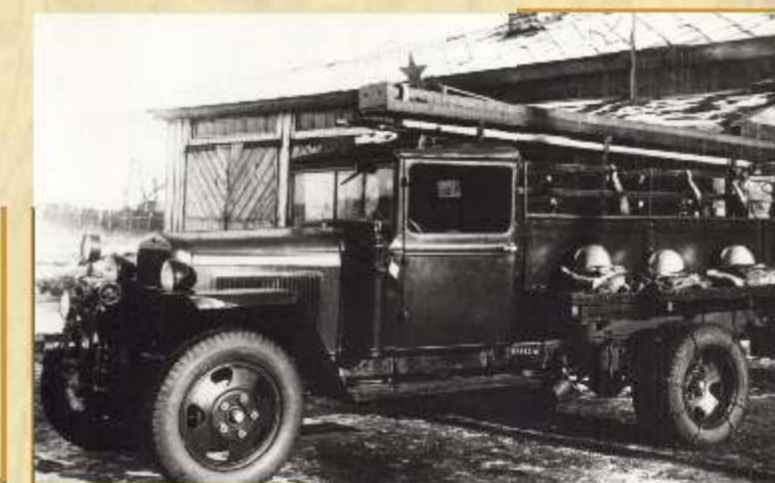
Пожарный автомобиль, стоявший на вооружении пожарной части г. Людиново (1943-1950 г.)

Постепенно начинает вновь возрастать роль ДПО и ДПОД, ведь в годы предшествующие Великой Отечественной Войне, они занимали крепкие позиции. В целях укрепления материальной базы добровольных пожарных дружин в 1954-55гг. было запланировано построить в области 953 пожарных сарая, 769 пожарных водоема, приобрести 992 конно-бочечных хода, 64 ручных пожарных насоса, 29 мотопомп, 435 огнетушителей.