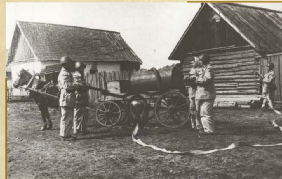
пожарная команда г. Людиново на пожарно-тактических учениях

помещения Райбыткомбината, большой ущерб был нанесен пожарами в магазинах Людиновского, Угодско-Заводского, Мещовского, Барятинского районов.