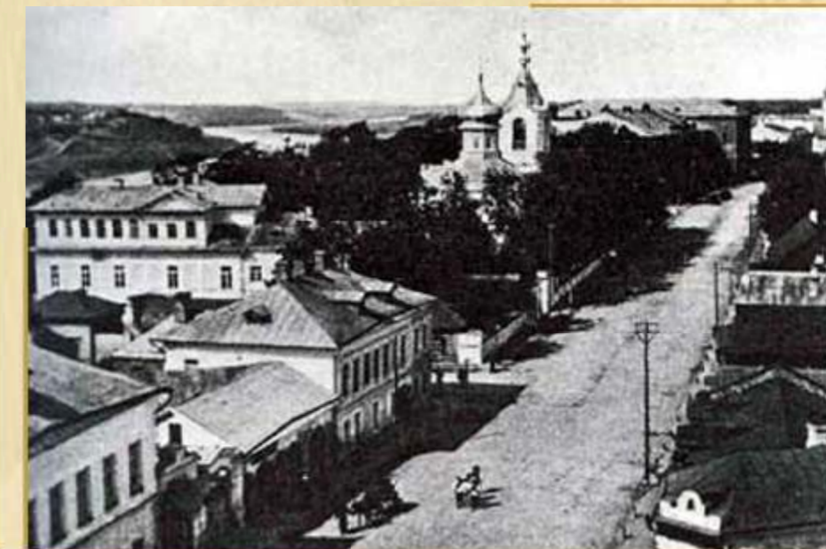
Калуга (начало XX века)